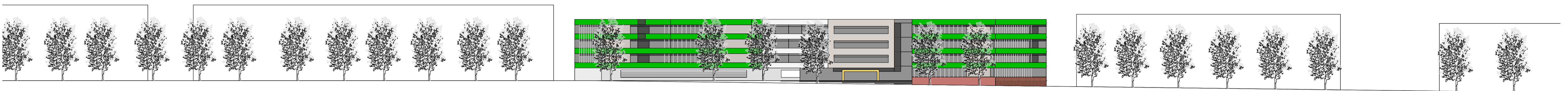
Ansicht von der Sonnenallee 1:500