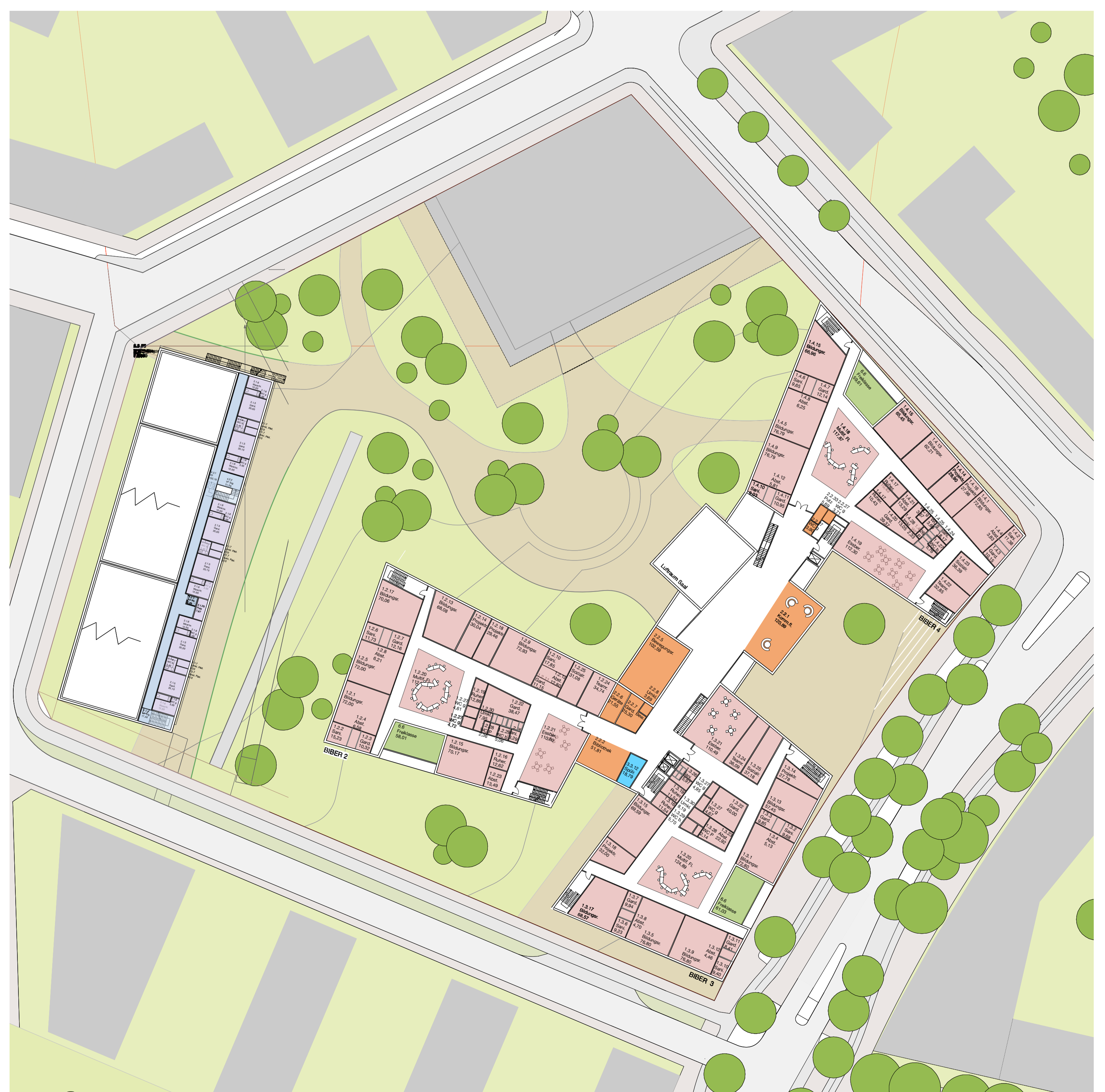
Grundriss 1. Obergeschoss 1:500