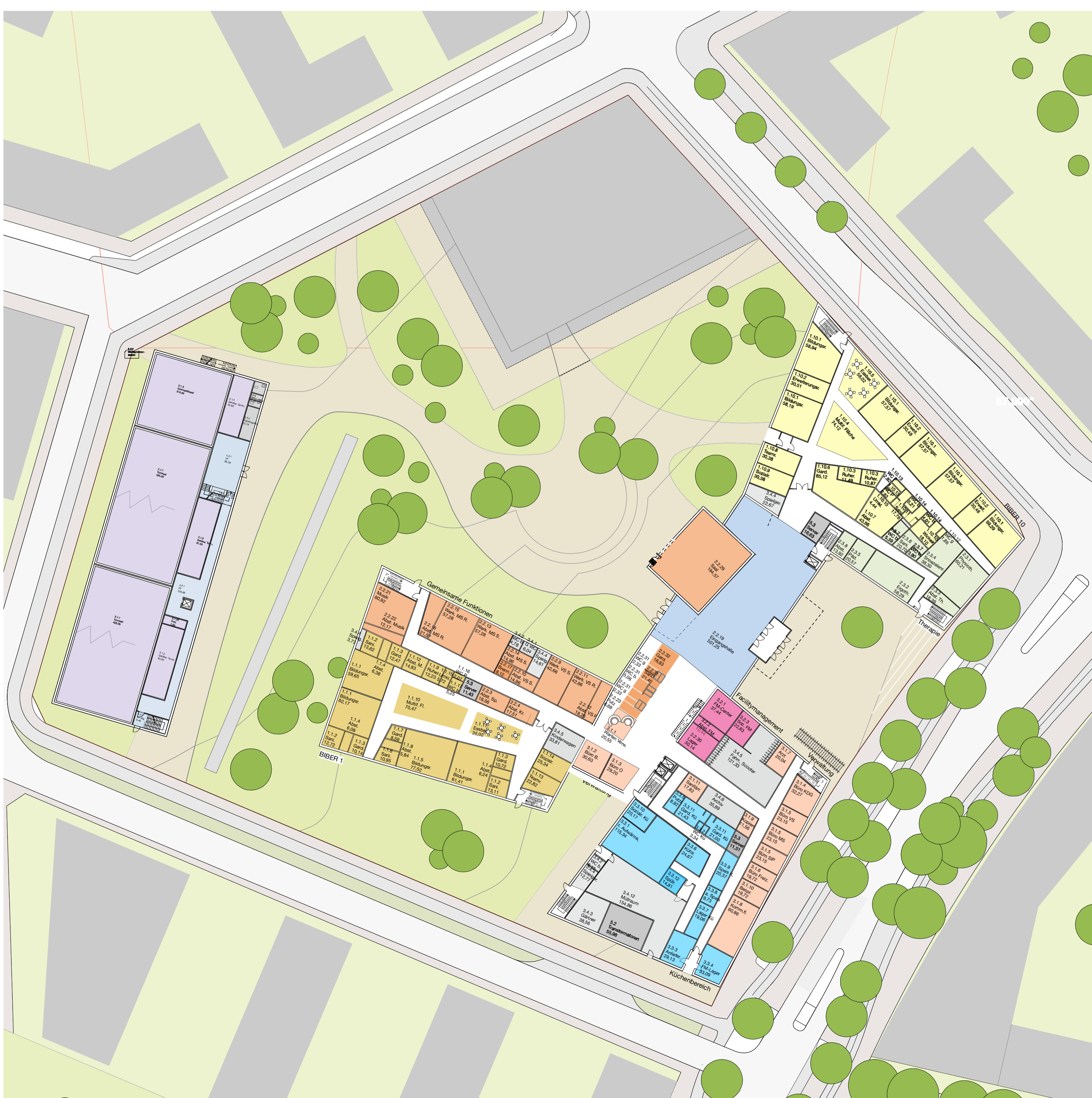
Grundriss Erdgeschoss 1:500

Die Bildungsbereiche sind als eigenständige Einheiten organisiert. Wie kleine Dörfer liegen die Biber an den zentralen gemeinsamen Einrichtungen, welche um die Vertikalerschließung angeordnet sind.