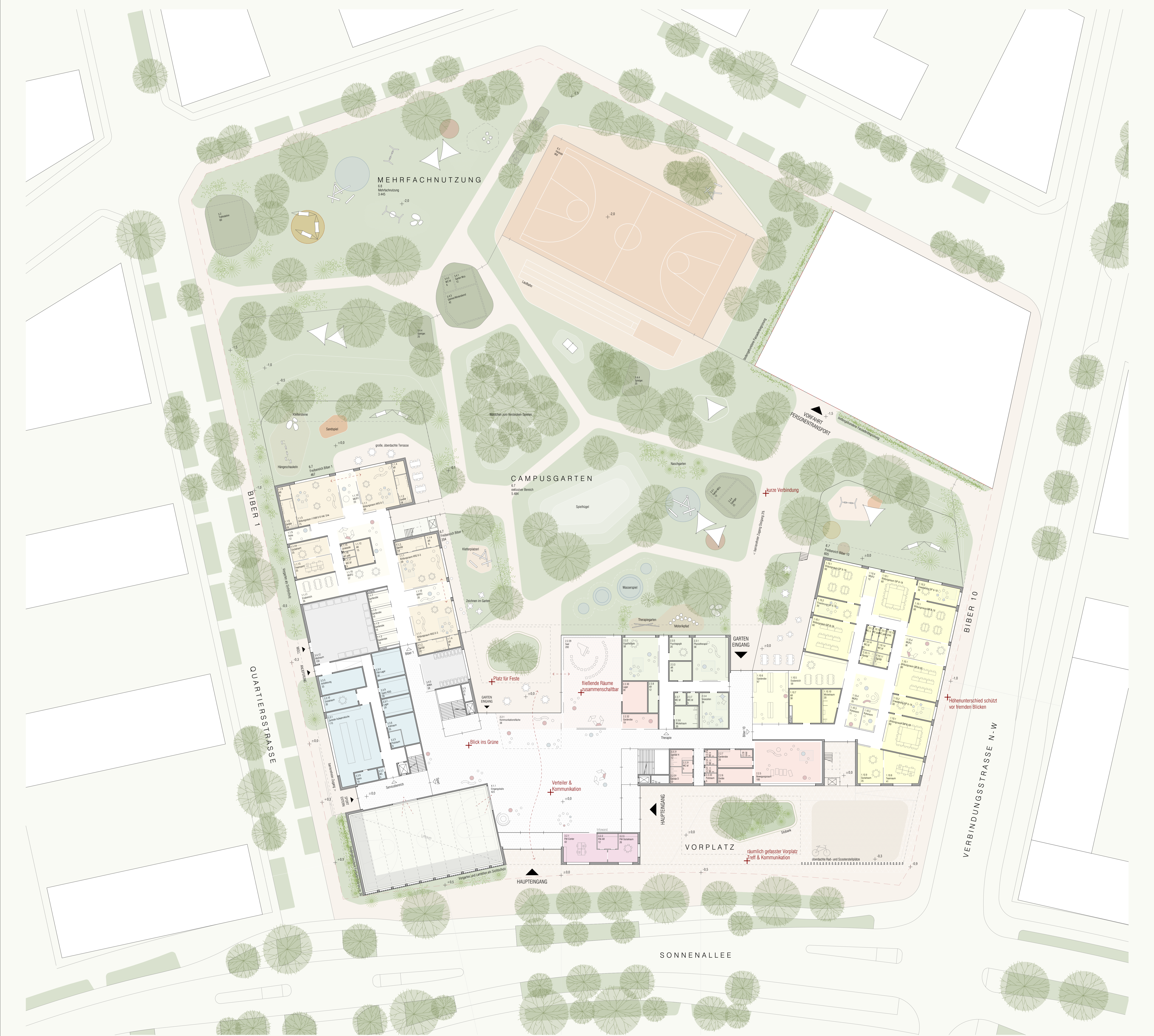
GRUNDRISS EG . M 1:250