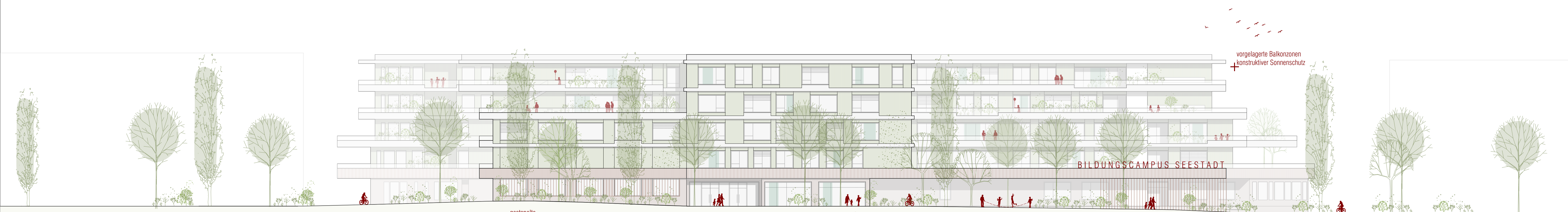
ANSICHT SONNENALLEE . M 1:250