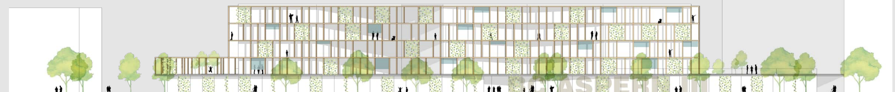
ANSICHT SÜD-OST - EINGANG 1_500