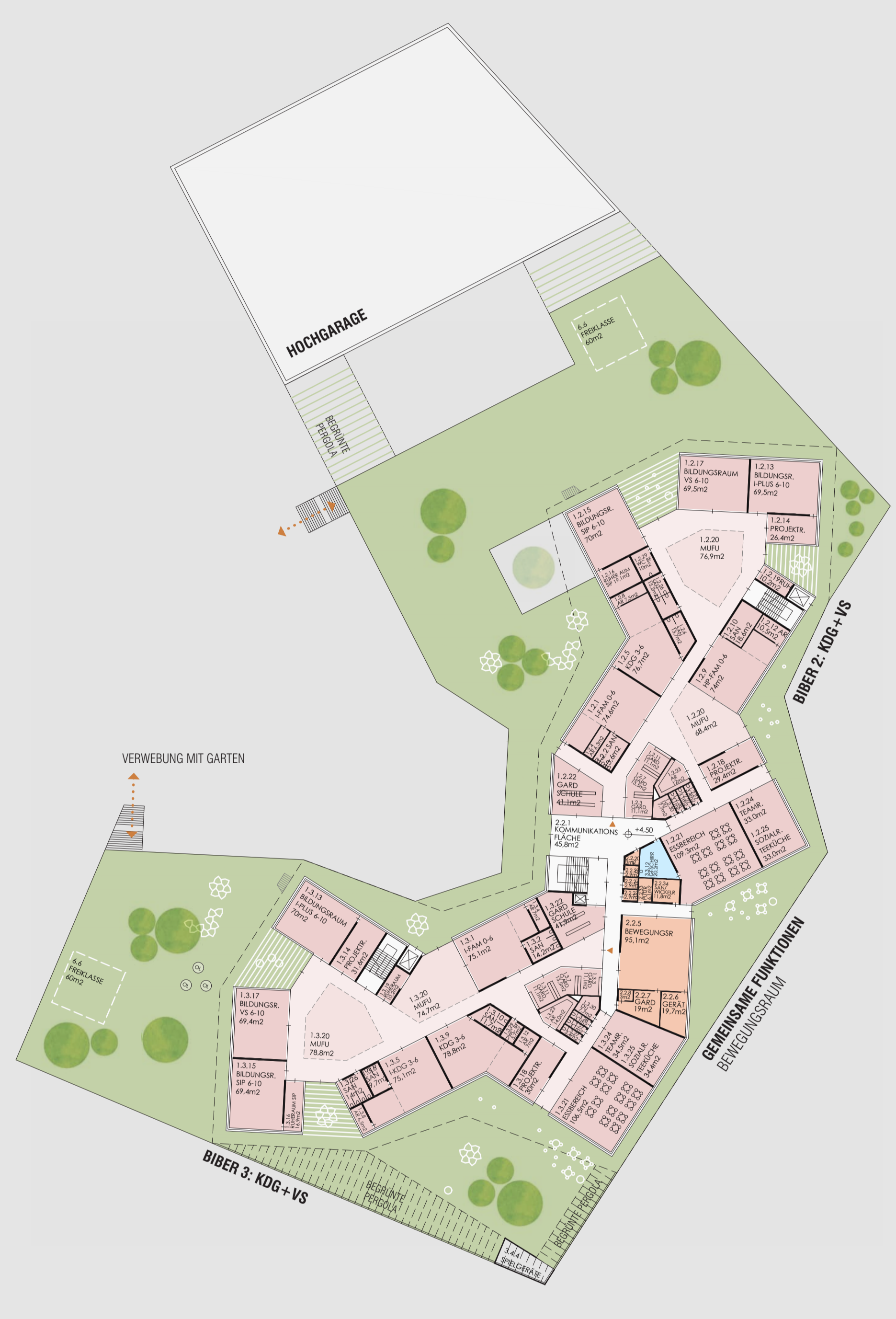
1 GRUNDRISS OG 1_500