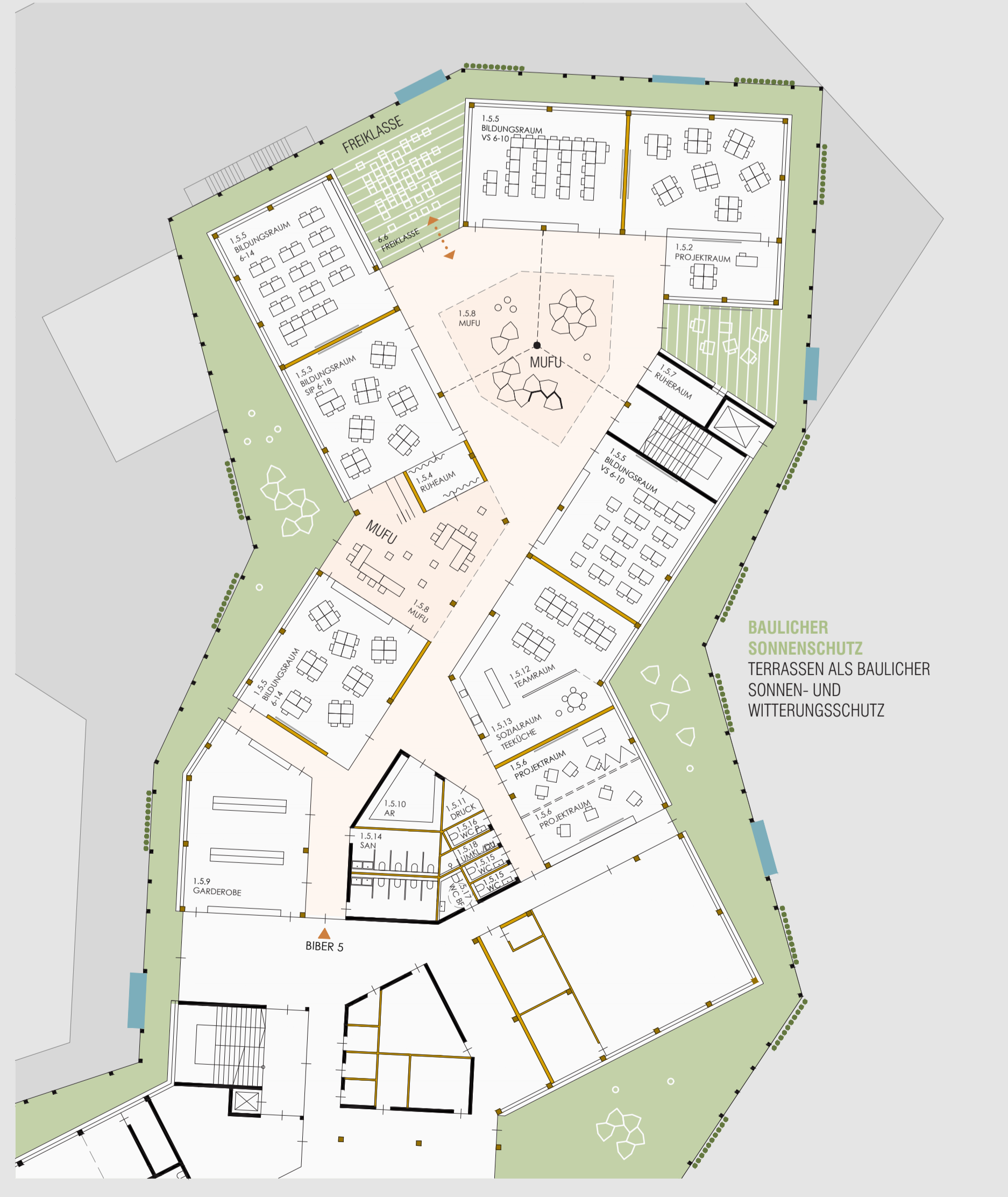
1 BIBER 5 1_250