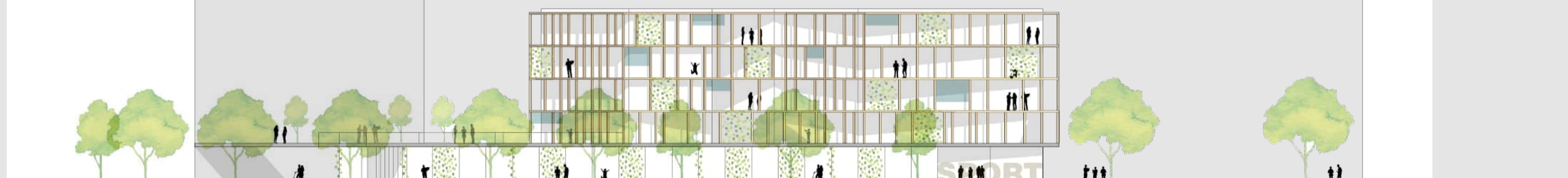
ANSICHT SÜD-WEST 1_500