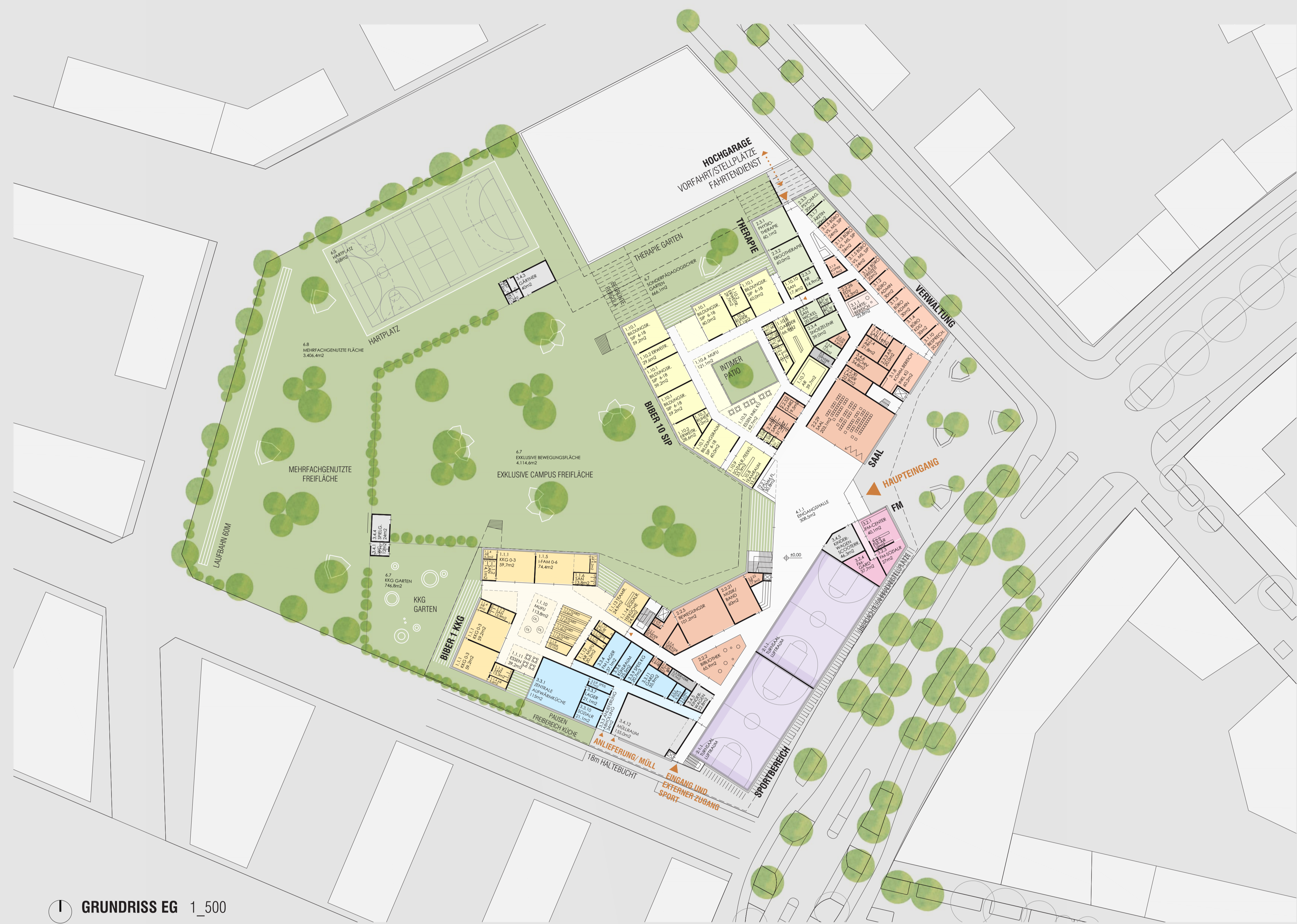
1 GRUNDRISS EG 1_500

Zur optimierten Betriebsführung wird ein Energiemonitoringsystem eingesetzt, welches die wesentlichen Energieflüsse aufzeichnet und Rückblicke auf Optimierungspotential schließt. Das Energiemonitoringsystem wird in die GLT integriert. Die wesentlichen Datenpunkte wie Temperaturen und Zählwerte liegen auf der GLT auf und können von dort in Echtzeit oder als Trend eingesehen und ausgewertet werden. Für alle unterschiedlichen Nutzungen sind Sub Zähler vorgesehen, weitere Zähler werden für den Aufbau des Monitoring-Systems eingeplant.