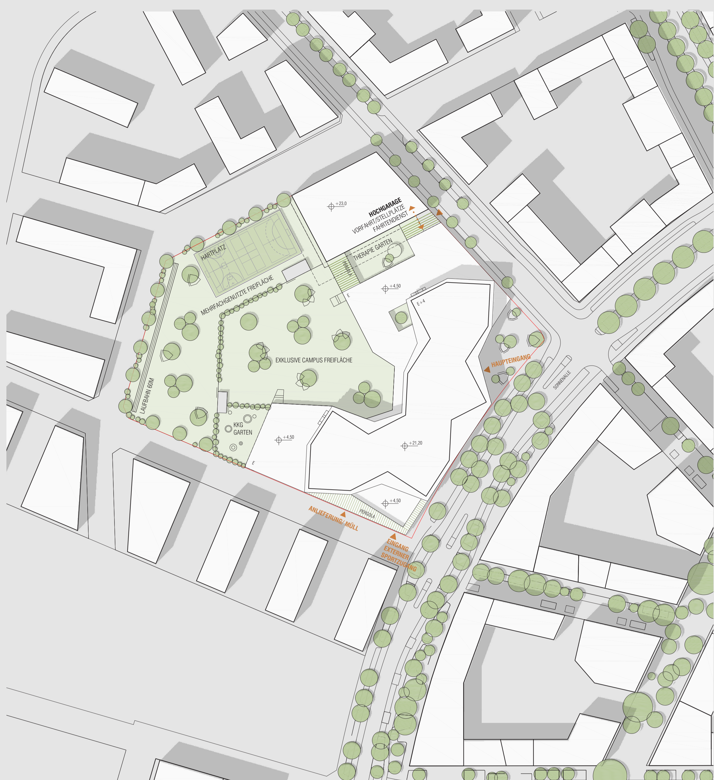
1 LAGEPLAN 1_1000

GRÜNFASSADE: Durch die vorgelagerten Freiraumbänder stehen den Rankpflanzen sehr viele funktionierende Trägerstrukturen zur Verfügung die für wichtige Mikroklimaverbesserung sorgen (Luftverbesserung, Feinstaubbindung, Verdunstungskälte)