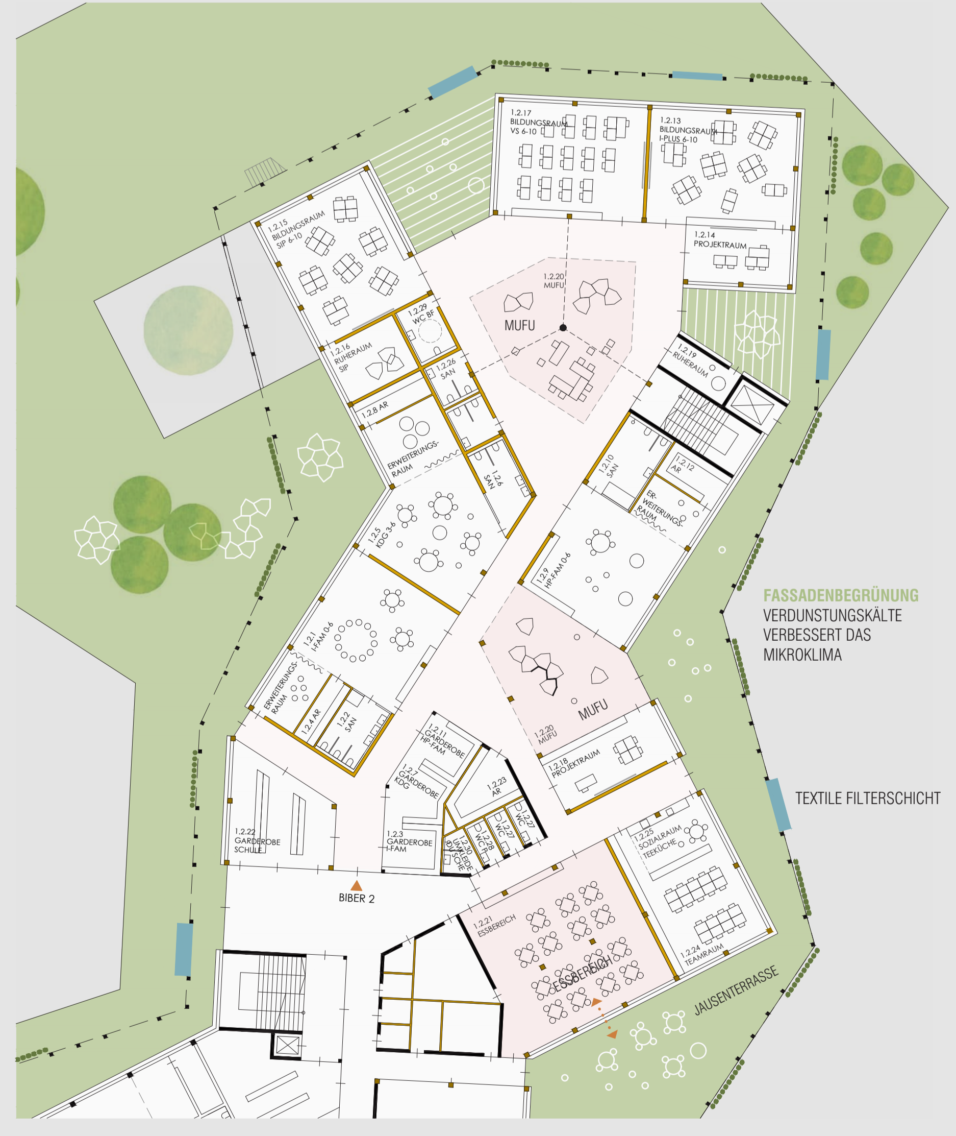
1 BIBER 2 1_250