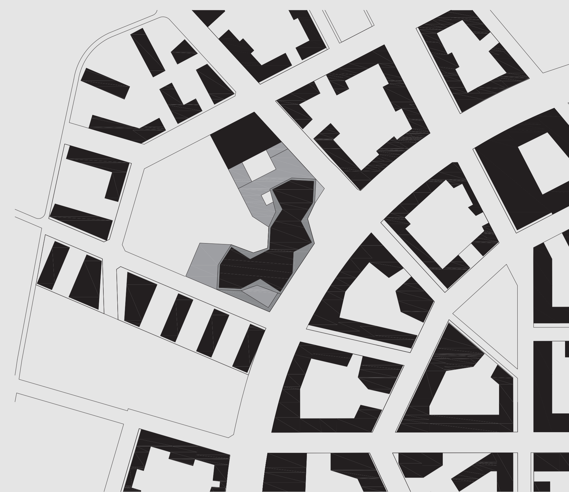
1 STRUKTURPLAN 1_2000